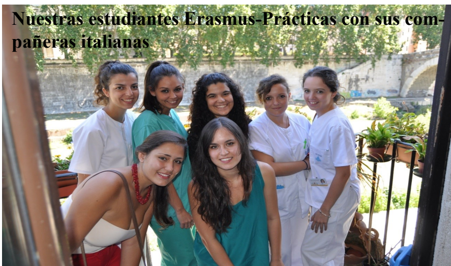
Nuestras estudiantes Erasmus-Prácticas con sus compañeras italianas

Las prácticas a realizar por los estudiantes habrán de estar directamente relacionadas con los estudios en los que se encuentran matriculados. Existen 2 posibilidades: