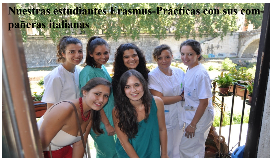
Nuestras estudiantes Erasmus-Prácticas con sus compañeras italianas

Las prácticas a realizar por los estudiantes habrán de estar directamente relacionadas con los estudios en los que se encuentran matriculados. Existen 2 posibilidades: